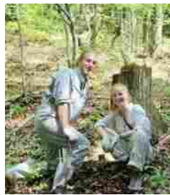
20代男女2名 (イスラエル)