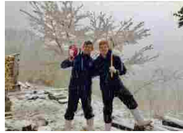
20代男性2名 (イスラエル)