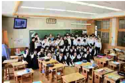
5月24日 久万中学校で特別授業