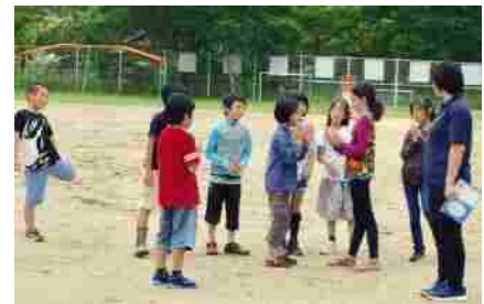
6/12 父二峰幼稚園・小学校で交流