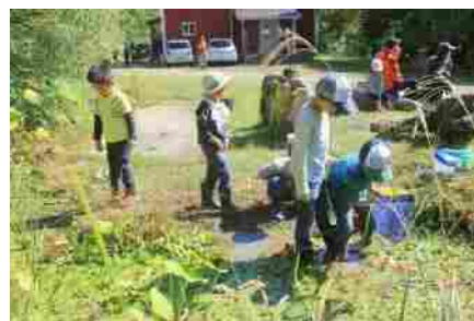
(NPO 法人みんなダイスキ 松山冒険遊び場との協働事業)