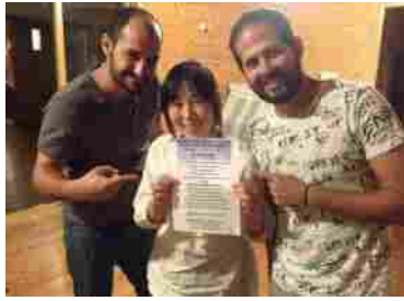
30代男性2名 (イスラエル)