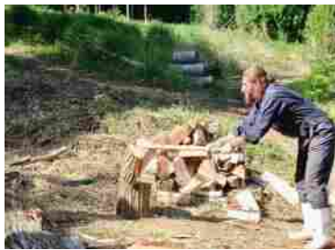
20代男性 (イスラエル)