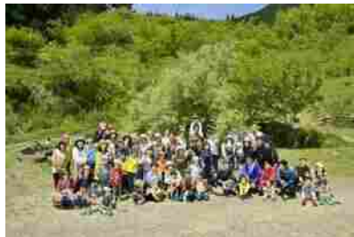
5月5日 山菜つみと 森のカマドごはん