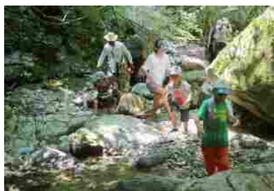
8月5日 手打ちうどん &沢登り体験